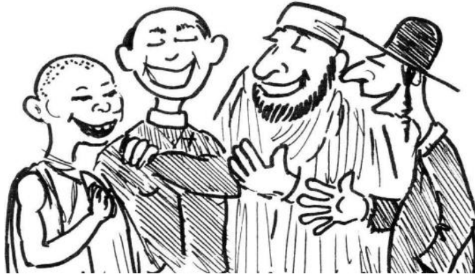
Pour nous aussi, les religions, c'est quelquefois compliqué

Nous comptons sur l'aide de nos lecteurs. En attendant, s'adresser à l'Evêché et à la Maison du Protestantisme.